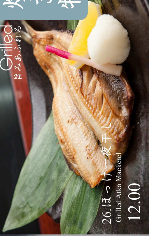
26.ほっけ一夜干し Grilled Atka Mackerel 12.00