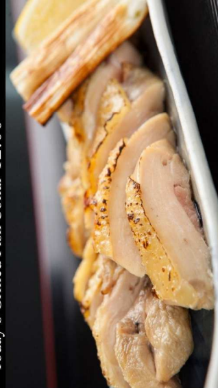
30.鶏もも肉の直火焼き (たれ・塩) Grilled Chicken (Japanese BBQ/Salt) 12.00