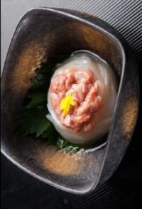
7. 烏賊酒盗和え Seasoned Squid with Salted and Fermented Bonito Intestines 7.00