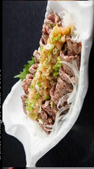
29.炙り牛のおろしポン酢Grilled Beef with Ponzu Vinegar 12.00