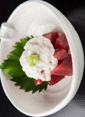
20. 鮪の山かけ (写真右) Grated Yam and Tuna (Right picture) 8.00

Consumer Advisory: Consuming raw or undercooked meats, poultry, seafood, shellfish, or eggs may increase your risk of foodborne illness. Individuals with certain health conditions may be at higher risk if these foods are consumed raw or undercooked. 消費者の方へ: 食肉、家禽類、魚介類、卵などの生や弱調理品を消費すると、食品媒介性疾患のリスクが高まる場合があります。特定の健康状態を持つ方は、これらの食品が生のままであるか、または調理されていない場合、事前に医師にご確認ください。