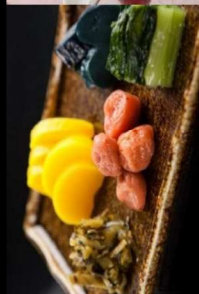
11. お漬物盛り合せ Japanese Pickles 6.00