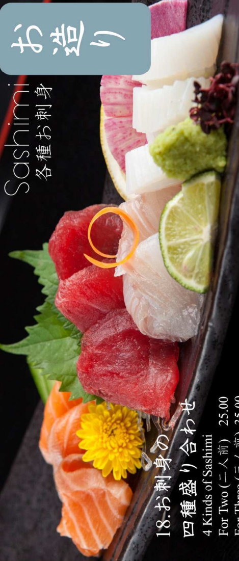
18. お刺身の 四種盛り合わせ 4 Kinds of Sashimi For Two (二人前) 25.00 For Three (三人前) 35.00