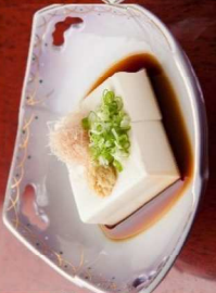
4. 冷や奴 Cold Tofu 5.00