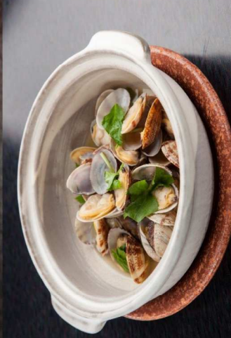
27.あさりのバター焼き Butter Firing of Clam 10.00