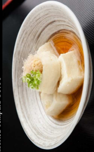
25.揚出し豆腐 Deep Fried Tofu 8.00