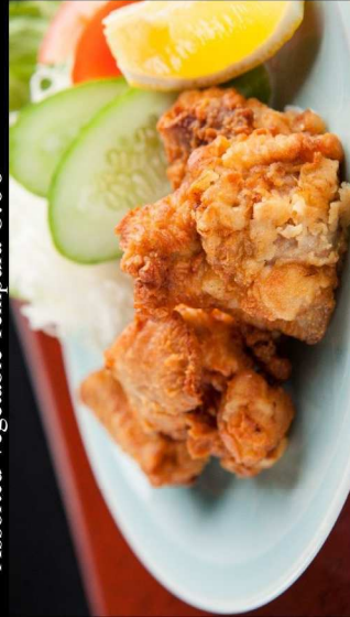
24.鶏の唐揚げ Deep Fried Chicken 7.00