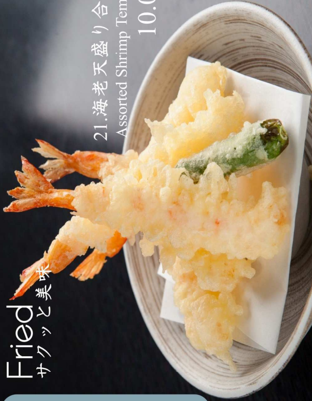
21.海老天盛り合せ Assorted Shrimp Tempura 10.00