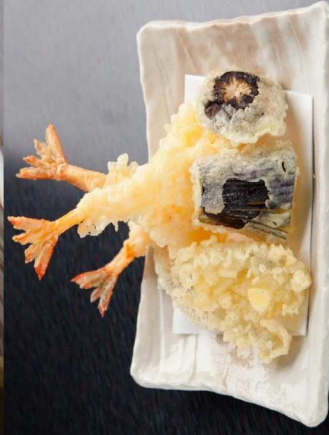
23.天麩羅盛り合せ Assorted Tempura 10.00