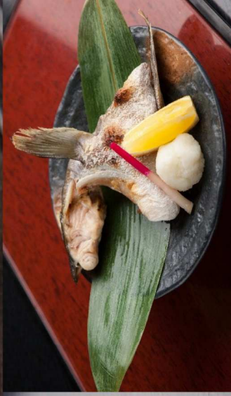
28.本日のかま焼き Today's Grilled Fish Collar 12.00