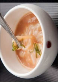
6. 塩辛 Salted Squid Guts 5.00