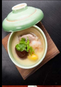
13. 特製茶碗蒸し Steamed Egg Custard 6.00