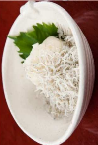
3. じゃこおろし Young Sardines & Radish 5.00