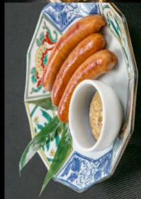
10. 焼ソーセージ Grilled Sausage 6.00