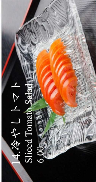
14. 冷やしトマト Sliced Tomato Salad 6.00