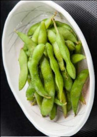
9. 枝豆の塩ゆで Boiled Green Soybeans 5.00