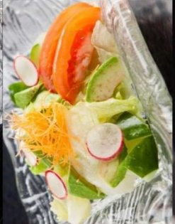
16. グリーンサラダ (写真左) Green Vegetable Salad (Left picture) 8.00 17. 海鮮サラダ (写真右) Seafood Salad (Right picture) 10.00