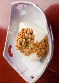
5. 豆腐納豆 Tofu Natto 6.00