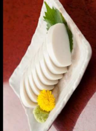
12. 板わさ Fish Cake with Wasabi 6.00