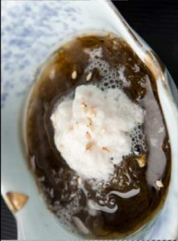
8. もずく酢 Mozuku Seaweed Vinegar 5.00