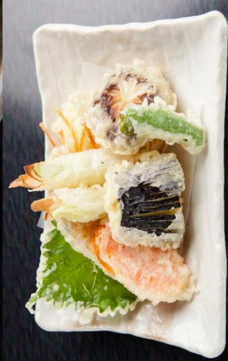
22.野菜天麩羅盛り合せ Assorted Vegetable Tempura 8.00