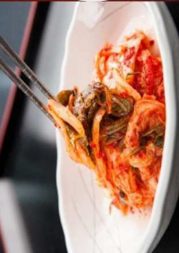
2. 白菜キムチ Kimchi 3.00